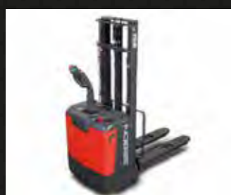
EPT en stapelaar